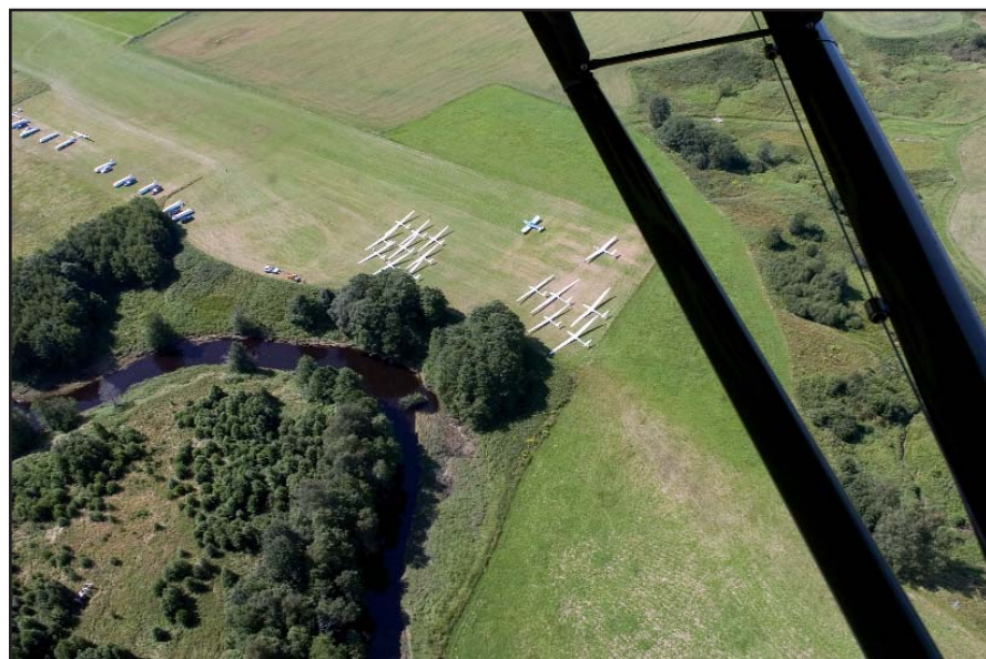
Startfältet fotograferas av Alingsås Tidning som besöker tävlingen.