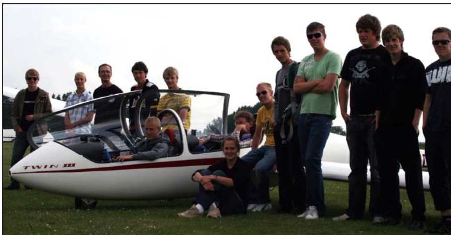
Ungdomsläger gruppbild i samband med ungdoms-DM.

– Det var en skön känsla att se molngatan hem. Plötsligen var det rena Autobahn, berättar Jim Körberg som de sista 17 milen på banan fick uppleva ett snitt på fina 132 km/t.